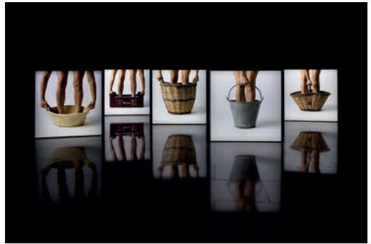
Isabel Banal. Traginadores , 2016. Museu Abelló (Mollet del Vallès). Dipòsit Col·lecció Nacional © Isabel Banal

El contacte proper amb la terra, amb la natura, genera en els cossos una mena de saviesa força pròpia del món rural.