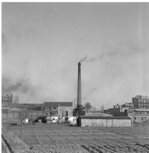
Francesc Català-Roca. Vista d'una bòbila, 1950-1959.