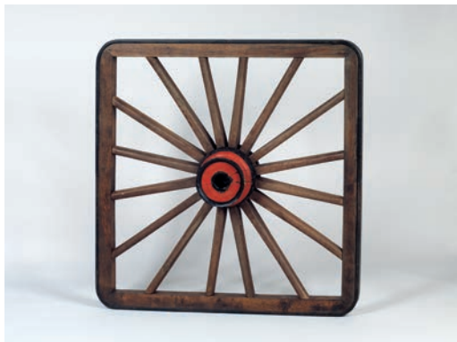
Joan Brossa. Roda, 1969 (1989). Col·lecció MACBA. Consorci MACBA. Fons Joan Brossa. Dipòsit Fundació Joan Brossa

Finals del segle XIX: l'acceleració. De mica en mica, les noves tecnologies agrícoles es van anar estenent arreu del planeta. A Catalunya, la sofisticació tecnològica de les tasques del camp va arribar a través d'empreses com J. Trepat, de Tàrraga, que feia màquines de tracció animal però capaces de realitzar amb molt menys temps i esforç les feines recurrents de la pagesia catalana.