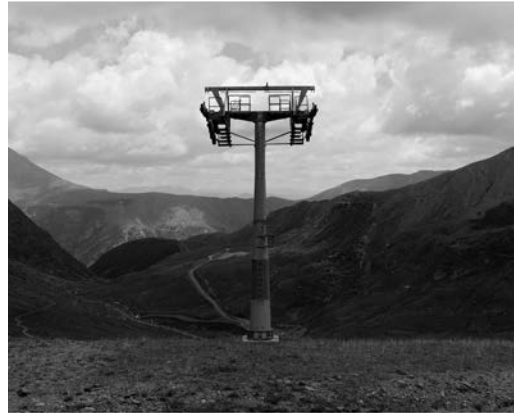
Jordi Calafell. Pastoral pallaresa. Caminant en estat d'alerta. Fil·là # 1_03 , 2015. Jordi Calafell Garrigosa

Aquest àmbit ensenya un paisatge transformat per la manera de fer pagesa. La manera de fer del passat i també l'actual, condicionada per la globalització, el mercat i el neoliberalisme més ferotge. Per convidar a la reflexió sobre les diferències, les tensions i les contradiccions entre el paisatge agrícola del passat i l'actual, aquest àmbit s'estructura mitjançant binomis d'obres antigues i peces més contemporànies, posant en relació, entre d'altres, pintors com Jaume Morera i el fotògraf Jordi Calafell; un oli de Joaquim Vayreda i una acció performativa d'Albert Gusi, o una tela d'Olga Sacharoff i un paisatge d'Hernàndez Pijuan.