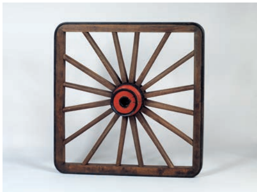
Joan Brossa. Rueda, 1969 (1989). Colección MACBA. Consorcio MACBA. Fondo Joan Brossa. Depósito Fundación Joan Brossa

Finales del siglo XIX: la aceleración. Poco a poco, las nuevas tecnologías agrícolas fueron extendiéndose por todo el planeta. En Cataluña, la sofisticación tecnológica de las tareas del campo llegó a través de empresas como J. Trepat, de Tàrrega, que fabricaba máquinas de tracción animal pero capaces de realizar con mucho menos tiempo y esfuerzo los trabajos recurrentes del campesinado catalán.