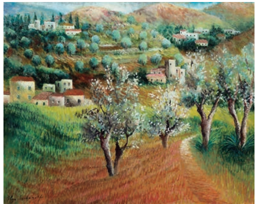
Olga Sacharoff. Paisaje de Mont-roig , 1916. Colección de Arte Banco Sabadell