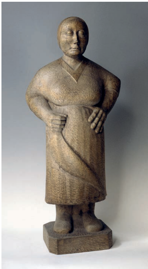
Leandre Cristòfol. El ama aldeana , 1935. Colección MORERA. Donación de Francisco Cristòfol, 1999. © Leandre Cristòfol, Ayuntamiento de Lleida, 2026

El contacto cercano con la tierra, con la naturaleza, genera en los cuerpos una especie de sabiduría que es bastante propia del mundo rural.