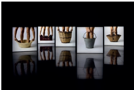
Isabel Banal. Traginadoras , 2016. Museo Abelló (Mollet del Vallès). Depósito Colección Nacional © Isabel Banal

Las representaciones de este espacio nos ayudan a visualizar algunos rostros rurales de antes y de ahora: desde la humildad de una escultura femenina de Leandre Cristòfol hasta el retrato aristocrático del alcalde de Almatret pintado por Miquel Viladrich, pasando por la visión contemporánea de los hombres y mujeres custodios del campo que ofrecen las piezas, críticas, reivindicativas y comprometidas, de Asunción Molinos e Isabel Banal.