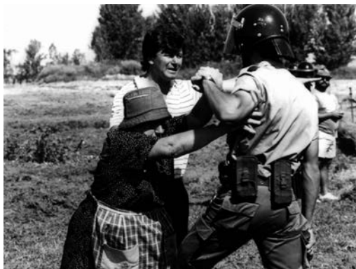
Esther Remacha. Luchadoras por la tierra 3, 1990. Colección MORERA. Depósito de la Generalitat de Catalunya. Colección Nacional de Fotografía, 2022

En los últimos tiempos, parece que luchas que acontecen en la realidad alejada de grandes ciudades y áreas metropolitanas afectan, únicamente, a los intereses del mundo rural. O, mejor, de una parte de este. La llamada “revuelta payesa” movilizó a gente y maquinaria para reclamar mejoras y facilidades para el trabajo de agricultor.