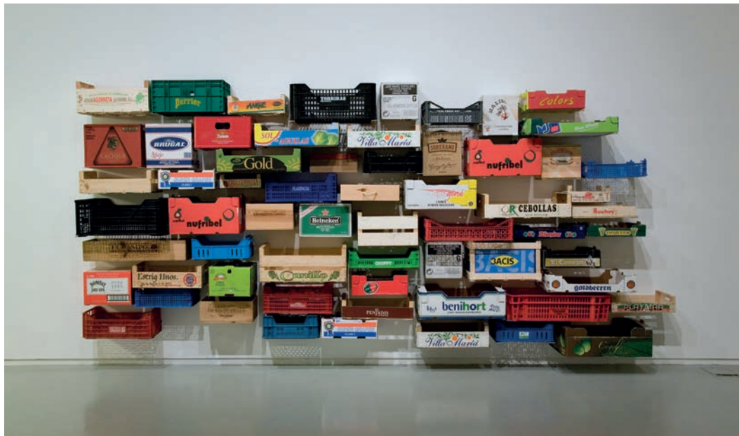
Curro Claret. Cajonera . 2003. Colección MORERA. Adquisición, VI Bienal Leandre Cristófol, 2008. © Curro Claret