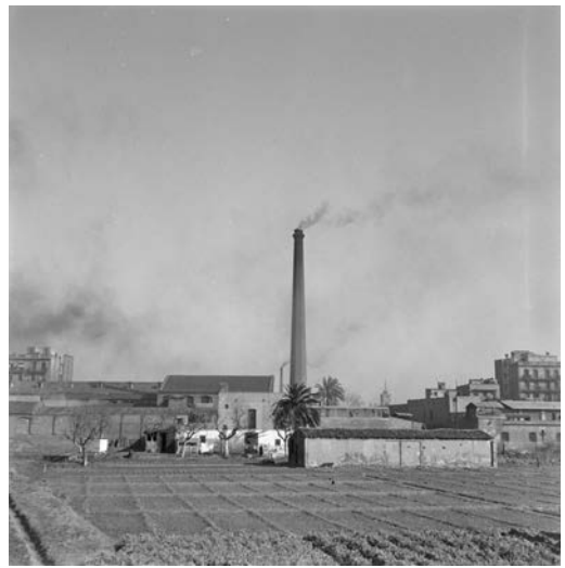
Francesc Català-Roca. Vista de un tejar, 1950-1959. Archivo Nacional de Cataluña (Fondo Francesc Català-Roca).

Las ciudades han ido perdiendo el componente rural que tuvieron durante siglos. La creciente industria trajo consigo un aumento de población y, al mismo tiempo, una expansión de las infraestructuras urbanas, que poco a poco ganaron terreno a todos los suelos cultivables que rodeaban lo que ahora son las áreas metropolitanas de las grandes urbes. Esta voluntad de la ciudad de ser cada vez más ciudad ha ido apartando las realidades agrícolas que la sustentan. Al mismo tiempo, las rápidas conexiones por carretera, la democratización de los servicios públicos, las